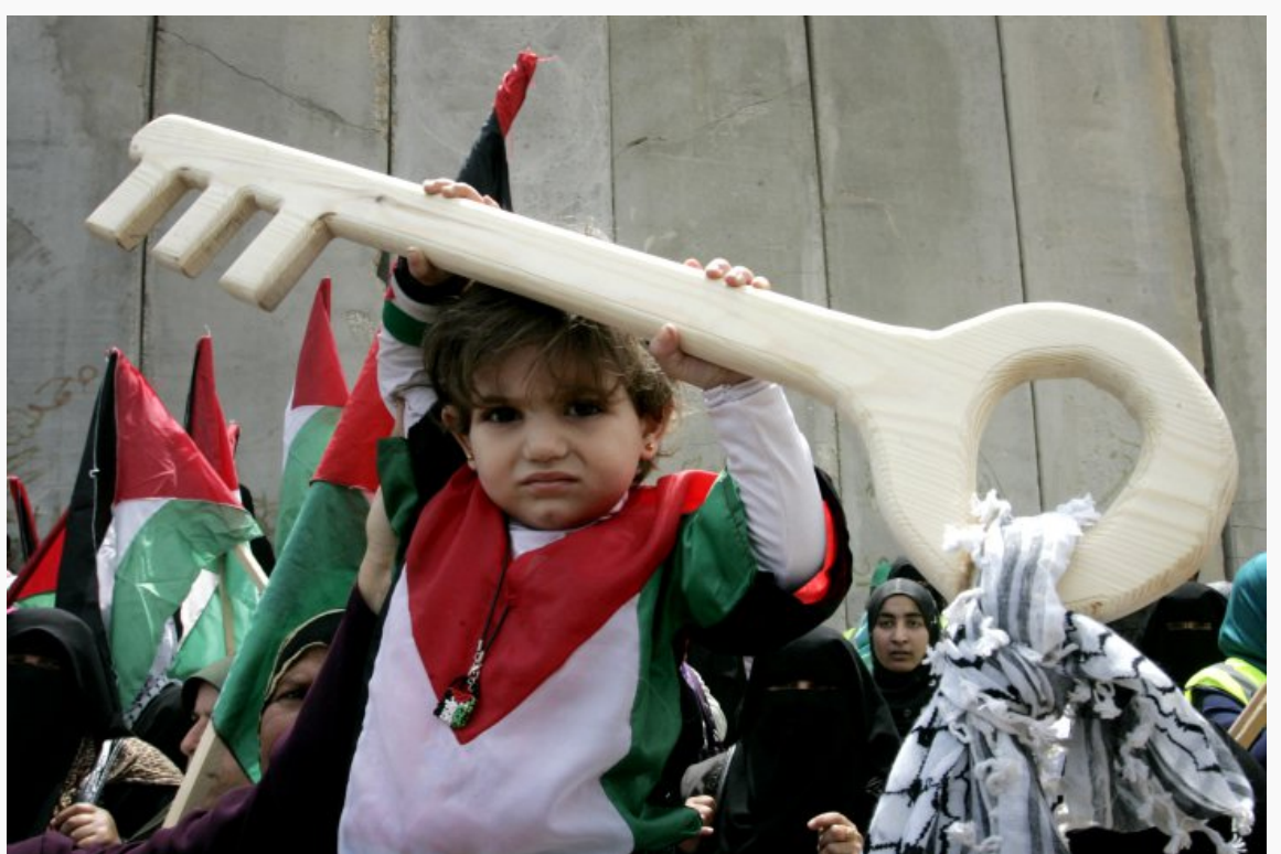
איפה הם היו בלי מדינה יהודית? הפגנות יום הנכבה.

"העובדה שאחרים בעולם מפרשים את זכותם להגדרה עצמית כהגמונית אינה מלבינה לחלוטין את הבחירה הישראלית בפירוש זה" (עמ' 99).