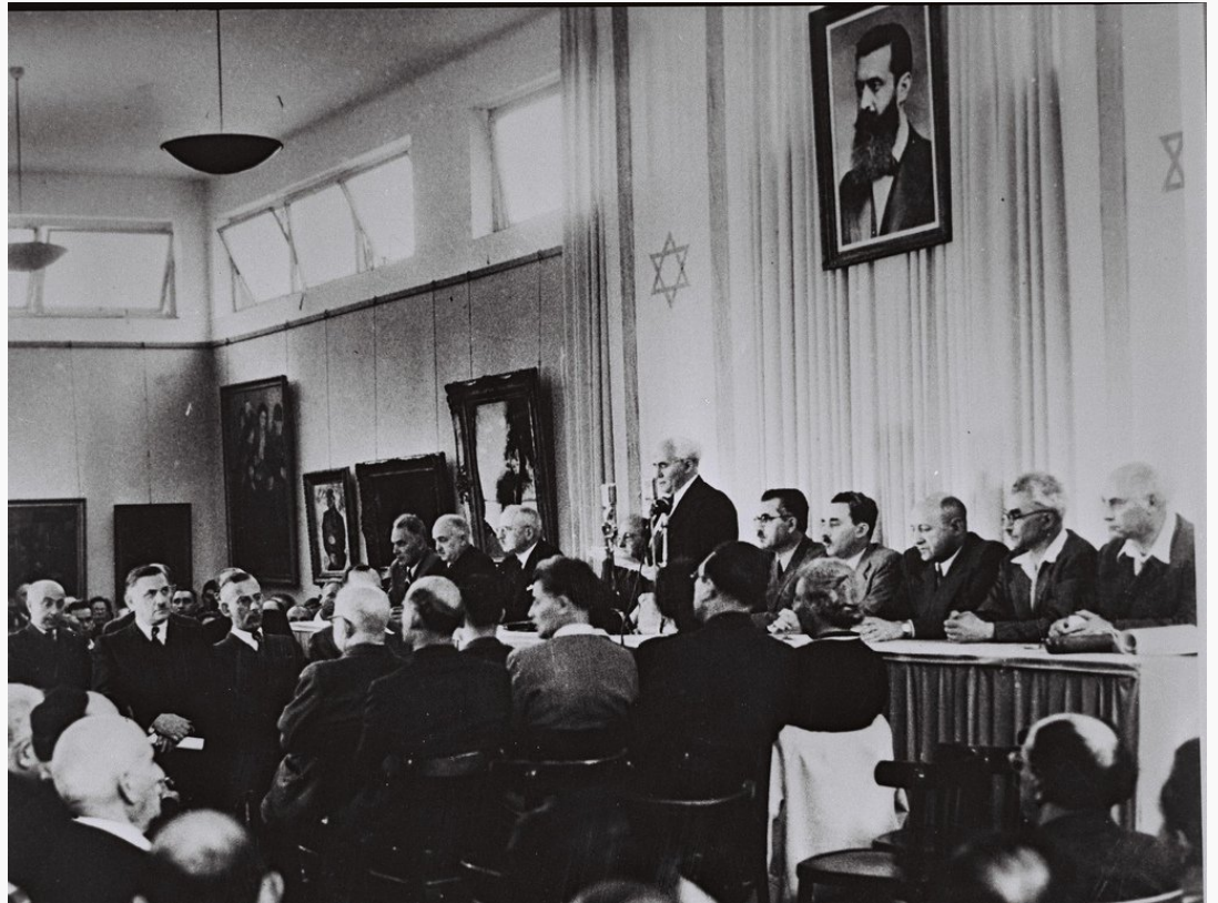
"להתייחס באופן שווה לתביעות מקבילות"; הכרזת העצמאות